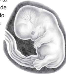
gestación de 6 semanas

En el tercer mes, medías dos pulgadas más y pesabas la suma total de una onza. Tus huellas digitales –las mismas que tienes ahora– se definían claramente. Dormías, despertabas y hacías ejercicios con mucha energía – girando tu cabeza, moviendo los dedos de tus pies, y abriendo y cerrando tu boca. Las uñas de tus pies y de tus manos se formaron, y si tus padres necesitaban ayuda decidiendo de qué color pintar las paredes de tu cuarto, hubiesen podido identificarte como hijo o hija. Respirabas el fluido amniótico para ayudarte a fortalecer tu sistema respiratorio, y tus cuerdas vocales estaban completas. A veces, parecía como si estuvieras llorando. (¿Será que no te satisface el color de tu cuarto?)