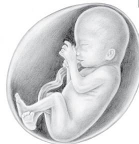
4 meses de gestación

En el cuarto mes diste un estirón, alcanzando a medir entre ocho y diez pulgadas y pesabas media libra o más. Se comenzó a notar el embarazo en tu mamá y ya ella sentía cuando te movías. Tu corazón bombeaba hasta veinticinco cuartos de galón de sangre diariamente. Lo creas o no, ya se podían identificar en ti expresiones faciales similares a la de tus padres. También aprendiste como chuparte el dedo - un hábito probablemente difícil de romper después.