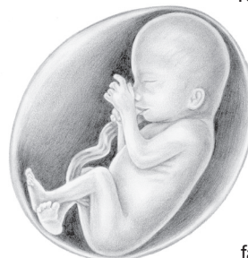
4 months gestation

You hit a growth spurt in month four, reaching eight to ten inches and a half pound or more. Mom began to show and feel you move, and your heart was pumping up to 25 quarts of blood each day. Believe it or not, facial expressions similar to your parents' were identifiable at this time. You also learned what may later have become a hard-to-break habit: sucking your thumb.