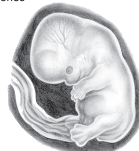
6 weeks gestation

In month three, you were two inches in length and weighed a grand total of one ounce. Your fingerprints — the same ones you see now — became evident. You slept, woke and exercised energetically — turning your head, curling your toes and opening and closing your mouth. Your fingernails and toenails formed and if your parents wanted help deciding what color to paint the nursery, they could have now identified you as a son or daughter. You breathed amniotic fluid to help strengthen your respiratory system, and your vocal cords were complete. At times, it might have appeared you were crying.