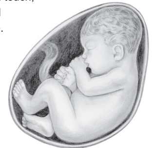
7 months gestation

You had a dim look at your cozy surroundings when your eyelids opened during month seven. You could taste and touch, and you recognized your mother's voice. Strengthening muscles meant stronger and more frequent pokes at Mom's stomach. Throughout this last trimester you received antibodies from your mother via the placenta to help provide you immunity to diseases.